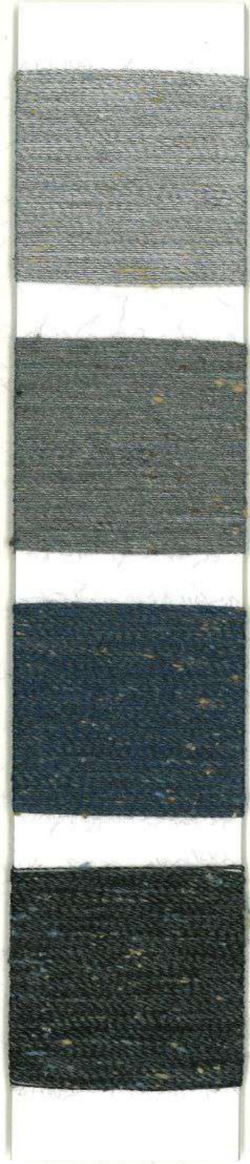
VAPORE 6549 - A