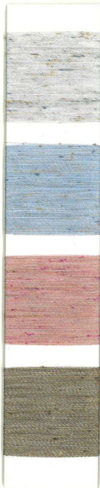
GHIACCIO 4908 - A